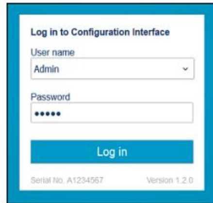
Figure 15 Indigo Login View

ご利用のブラウザでIndigoの無線構成インターフェースを開く際には、ログインが要求されます。ご利用可能なユーザーレベルが2つあります。